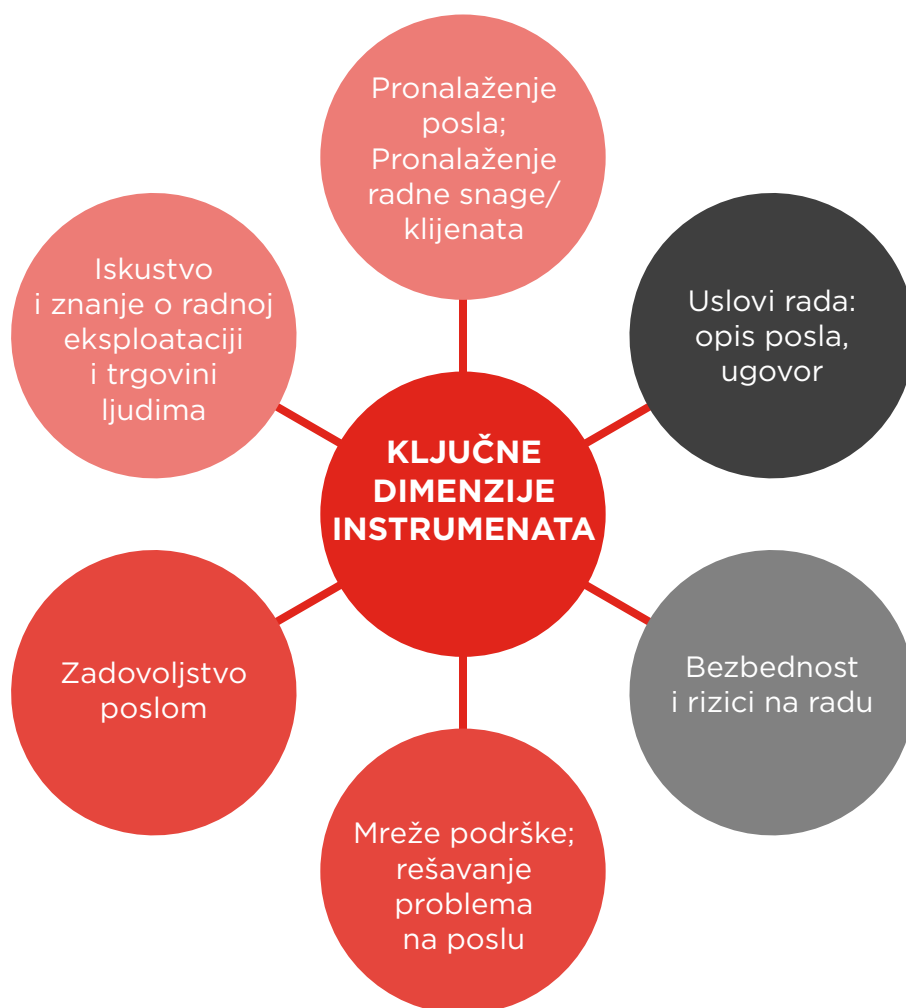
Slika 2: Ključne dimenzije istraživačkih instrumenata

Svi intervjui su obavljani po najvišim etičkim standardima. Sproveli su ih istraživači iz SeConS-a koji imaju veliko iskustvo u istraživanju osetljivih tema. Koristeći svoje sveobuhvatno prethodno znanje i iskustvo, sproveli su dubinske intervjue, strogo se pridržavajući relevantnih istraživačkih etičkih standarda i principa. Pre svakog intervjua, svaka ispitanica je dala informisanu saglasnost za učešće u intervjuu. Tim je preduzeo ozbiljne mere kako bi osigurao apsolutnu anonimnost svih ispitanica i poverljivost podataka dobijenih tokom intervjua, otklanjajući svaki rizik od nenamernog otkrivanja ličnih podataka o ispitanicama. Da bi se sačuvala anonimnost ispitanica, kao i njihovih klijenata, njihova imena su promenjena. Učesnice su izričito obaveštene da je njihovo učešće dobrovoljno i da se mogu povući u bilo kom trenutku bez ikakvih posledica.